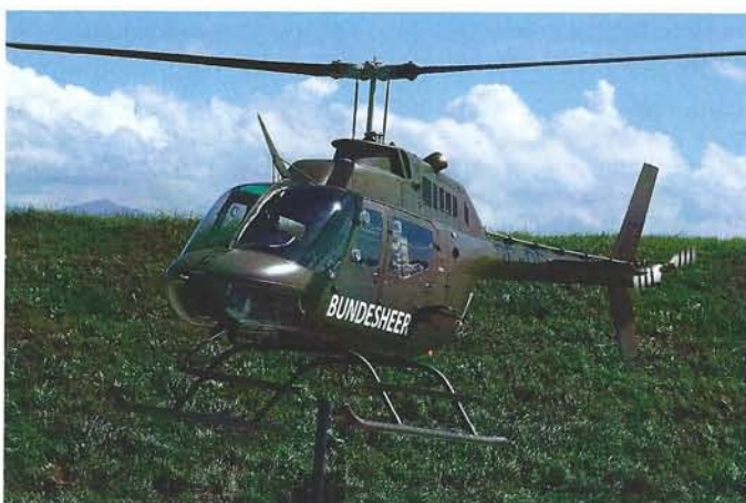
Gäste aus dem Nachbarland Österreich: Der Agusta Bell-206A-1 Kiowa vom Bundesheer