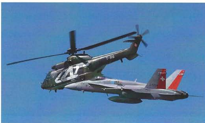
Ein wohl einmaliges Display zeigten die F/A-18 Hornet und der Super Puma der Schweizer Luftwaffe

Aus allen vier Himmelsrichtungen der Schweiz, Europas und der ganzen Welt kamen an die insgesamt 380'000 Zuschauer, Aviatikfans und Fotografen nach Payerne in der Westschweiz. Man hätte sich wohl keine bessere Art vorstellen und wünschen können, um 100 Jahre Schweizer Militärluftfahrt und die Jubiläen der Kunstflugstaffeln zu feiern. Eine grosse Ehre gab es dann auch für die AIR14 und ihren Direktor Ian Logan: Der Internati-