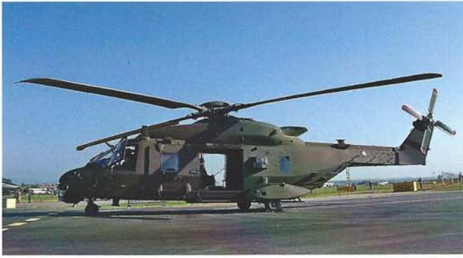
Der NH-90 der italienischen Armee wurde im Static Display gezeigt