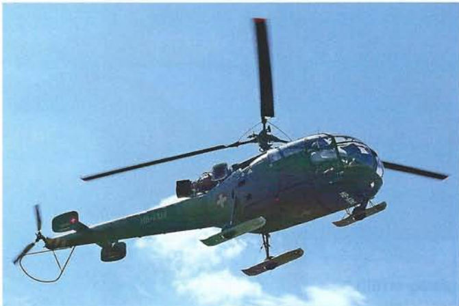
Die Sud-Aviation SE-3160 Alouette III wurde im Jahr 2010 ausser Dienst gestellt