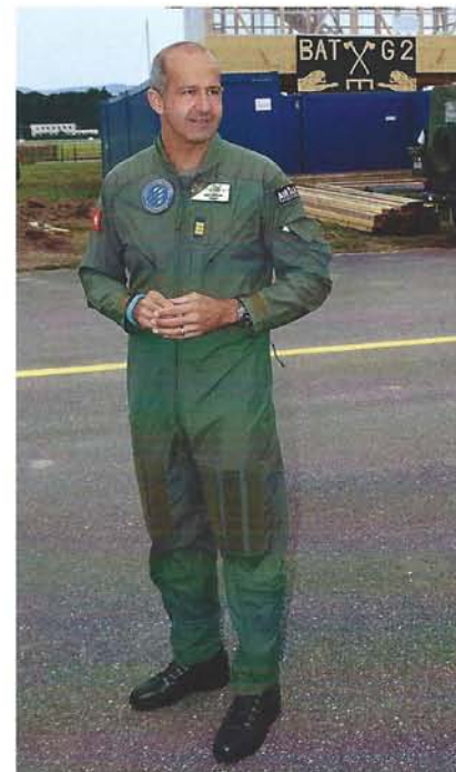
Direktor und „Vater“ des Erfolges der AIR14: Oberst im Generalstab Ian Logan