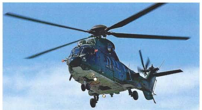
Abschlussbild des Super Puma Displays