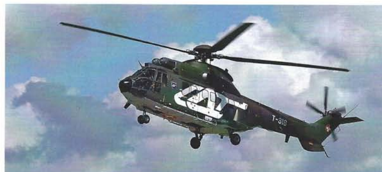
Der AS332 M1 Super Puma T-316 in der Sonderlackierung zum 50-jährigen Bestehen der Lufttransport Staffel 4

Die Mehrheit der Besucher reiste mit dem Auto an. Insgesamt wurden 81'200 Fahrzeuge gezählt. Staus in der Region um