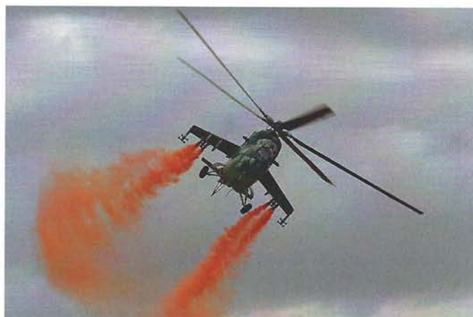
War im Flying Display zu sehen: Der Mil Mi-24 Hind der Tschechischen Luftwaffe

Armee und der Unterstützung der zahlreichen Partner funktionieren können.