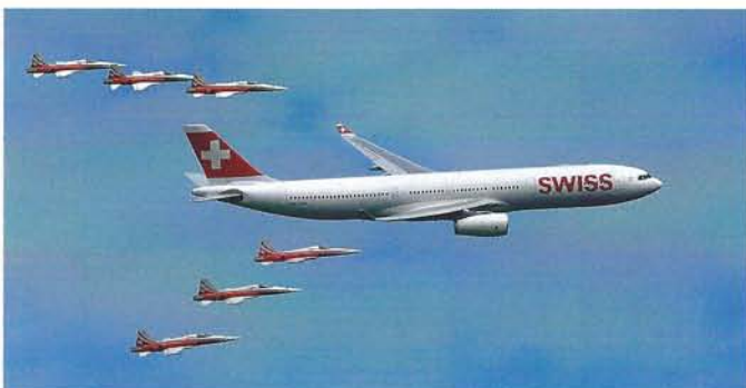
Zwei feste Grössen der Schweizer Luftfahrt: Gemeinsamer Überflug eines Airbus A330 der SWISS, begleitet von der Patrouille Suisse