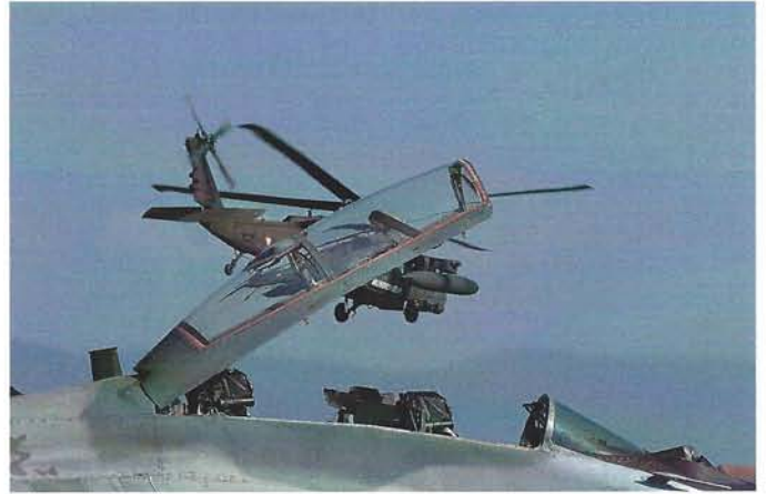
Goodbye Payerne ...