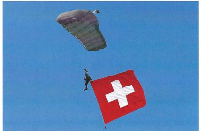
Die Fallschirmspringer der Schweizer Armee schwebten zu den Klängen der Schweizer Nationalhymne ein