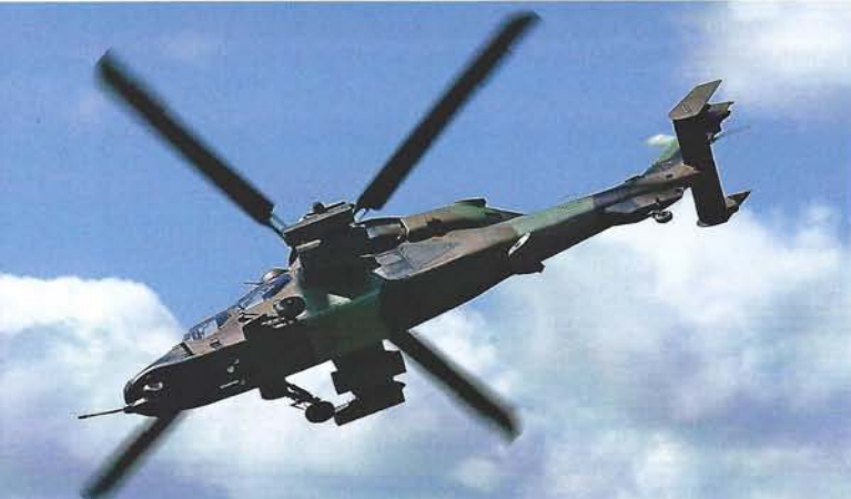
Der EC-665 Tiger HAP der Französischen Armee in Aktion