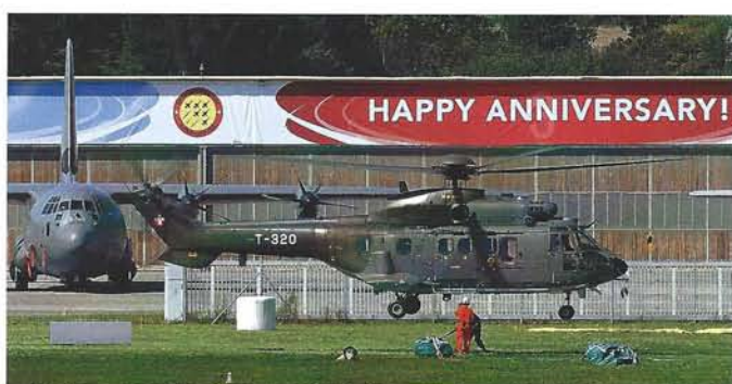
Der AS 332 M1 Super Puma T-320 demonstrierte u. A. den Transport von Aussenlasten

All dies hätte nicht ohne die Unterstützung der Bevölkerung und Nachbargemeinden, sowie die Professionalität der waadtländischen und freiburgischen Sicherheitskräfte, ohne die Truppen der