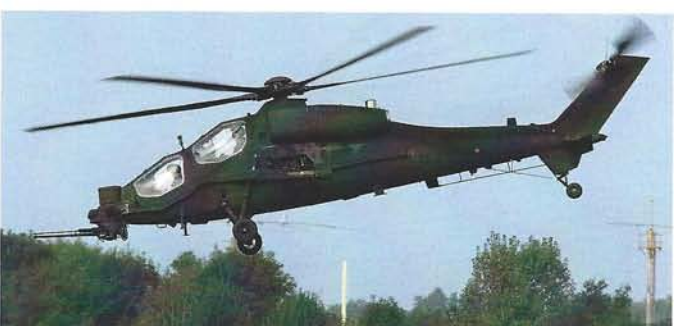
Start zum Flying Display: Der AgustaWestland AW-129CBT Mangusta der italienischen Armee