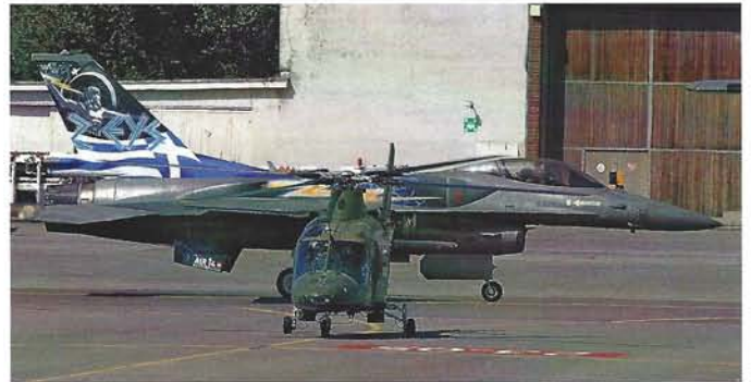
Der Agusta A-109 der Belgischen Luftwaffe und die F-16 des Hellenic Air Force Demo Teams „Zeus“

anderem in einer Formation von historischen und aktuellen Luftfahrzeugen, die vorwiegend im Lufttransport eingesetzt waren und sind. Dies Formation umfasste in der Historie eine Alouette II und eine Alouette III, während zwei Super Puma, zwei EC 635 und zwei Flugzeuge vom Typ Pilatus Porter die Gegenwart signalisierten.