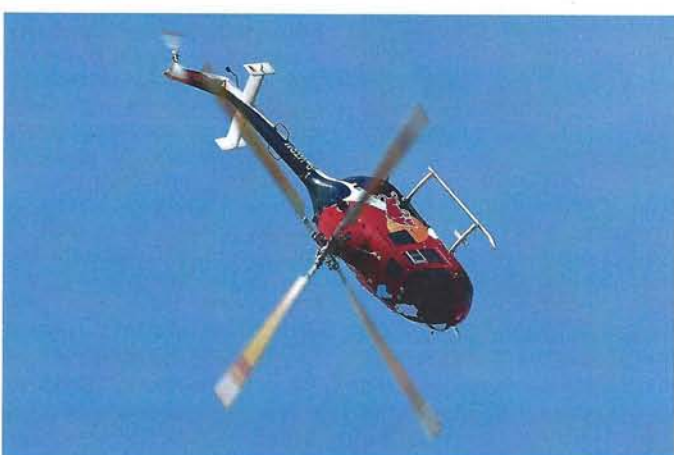
Eindrucksvolle Kunstflugfiguren geflogen von Rainer Wilke mit der BO 105 der Flying Bulls

Es donnerten nicht nur die verschiedensten Kampffjets und Flugzeuge aus 100 Jahren Militärluftfahrt und die vielen teilnehmenden Kunstflugstaffeln über die Broye-Ebene, es zeigten sich auch einige Helikopter am Himmel über Payerne: Einen Tribut zollte man den 100 Jahren Schweizer Militärluftfahrt unter