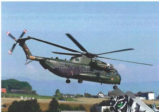
Start zum Heimflug: Der Sikorsky CH-53GS 85+00 der Deutschen Bundeswehr

„Wir wollten der Luftwaffe und der Luftfahrt unseren Tribut zollen, und das ist uns auf sehr eindrückliche Weise gelungen“. Und die AIR14 mit all ihren aviatischen Höhepunkten war ein unglaublicher Erfolg und eine wirkliche Hommage an die Jubilare und an die Luftfahrt. Danke Payerne! ■