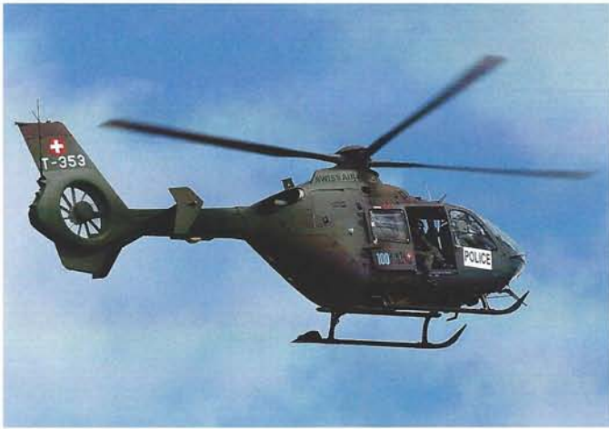
Waren im Polizei- und Rettungsdienst eingesetzt: Die EC 635