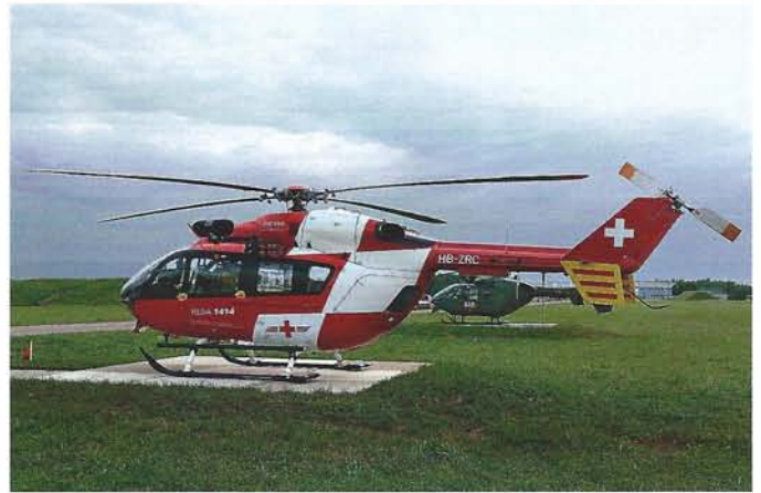
Je eine EC 145 der REGA und eine EC 635 der Schweizer Luftwaffe standen für Notfälle bereit