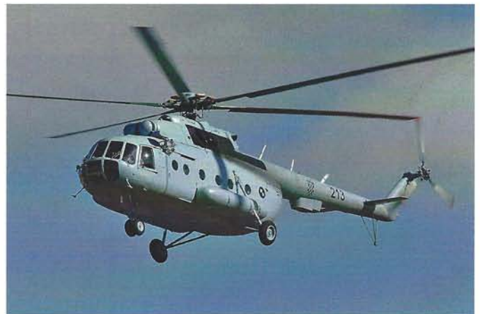
Der Mil Mi-8MTV-1 der kroatischen Luftwaffe im Anflug auf Payerne