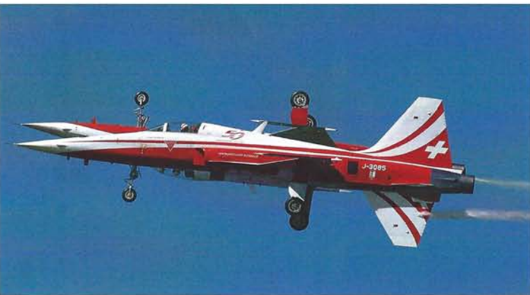
Spiegeln 50 erfolgreiche Jahre der Patrouille Suisse wider: Zwei F-5 Tiger