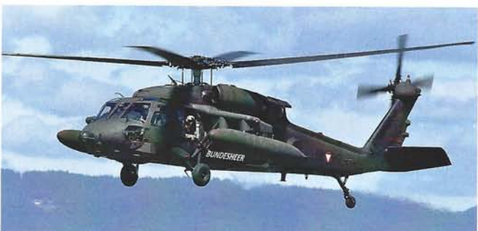
Ebenfalls vom Bundesheer und aus Österreich angereist ist ein Sikorsky S-70A-42 Black Hawk